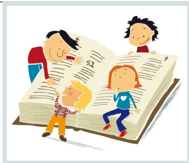
Illustrasjon: Elisabeth Moseng

”Vandring gjennom Bibelen for barn” er et prisbelønnet og vel utprøvd undervisningsopplegg tilrettelagt for mellomtrinnet i grunnskolen. Kurset, som er utarbeidet av Det Norske Bibelselskap, går over to dobbelttimer og gir elevene en allsidig læreopplevelse. Målet med undervisningsopplegget er at elevene på en fortellende og delvis dramatiserende måte får møte sentrale fortellinger i Bibelen. Her får de både oppdage hovedlinjene i Bibelen, og bli kjent med noen av hovedpersonene.