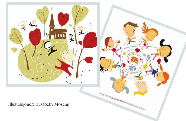
Illustrasjoner: Elisabeth Moseng